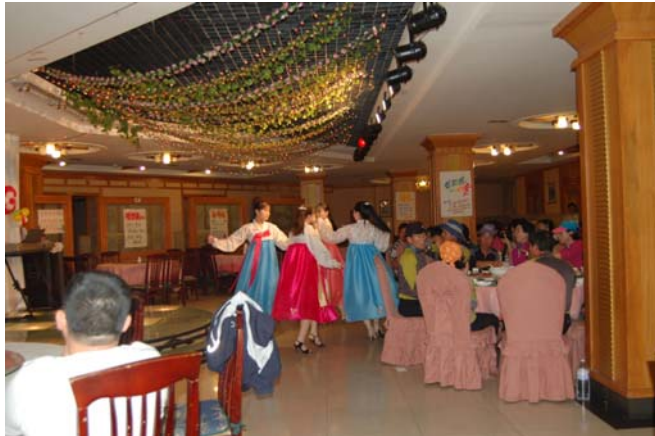
사진 2 연길 시내 북한식당 내의 한국 관광객

많은 사람들이 중국 동포의 앞날에 대해서 내 생각을 물었고 또 자기 생각을 얘기 해 줬다. 내 연구는 앞날이 어떨지, 어때야 하는지를 점치는 것이 아니라, 사람들이 지난 날과 오늘, 앞날에 대해 어떻게 생각하고 표현하는지를 보는 것이라고 설명했는데, 대부분의 사람들은 ‘그런 연구 뭐하러 하나’ 하는 표정을 지었다. 아래 사진 2는 북한 정부에서 운영한다는 연길 중심가에 위치한 한 식당의 내부다. 한국에서 온 관광객으로 가득했고, 그들이 아니면 그 식당은 문을 진작에 닫았을 것이라 했다. 그 관광객들 중에는 보수도 있을 것이고 진보도 있을 것이고, 또 민족 주의자도 있을 것이고, 아니면 보다 자유로운 사고를 하는 사람도 있겠다 싶었다. 하지만, 남과 북이, 연변이 만나는 횡수가 늘어나고, 그 장이 확대된다는 사실이 우리 민족의 앞날을 점치는데 가장 중요한 잣대인 것 같다. 앞으로 연길을 최소한 몇번은 더 가야 할 것 같다.