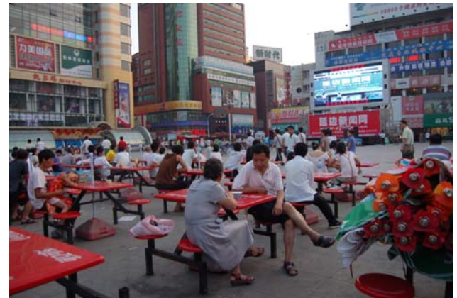
사진 1 연길 중심가 시민광장

과거 많은 유대인들이 이스라엘로 돌아 간 경우나 동유럽이나 구소련에 살던 독일인들이 서독으로 돌아 간 경우처럼, 모국 (homeland)의 정부가 국경 넘어 흩어져 살고 있는 디어스포라를 국민으로 받아들이는 것을 ethnic right of return 이라고 한다. 하지만 한국 정부는 여러 이유로 중국동포를 이주 노동자로 받아 들이고 있다. 일본, 헝가리, 터키도 한국과 비슷한 예에 속한다. 사실 트랜실베니아 지역에 살고 있는 헝가리 사람들은 연변의 조선족과 좋은 비교 연구가 된다. 국경이라는 개념이 없이 살고 있던 변방 사람들에게 국경이 그어지고, 국적이 주어지면서 중앙 정부와 소위 주류 사회는 이들에게 애국심을 강요하게 되고, 정체성과 소속을 묻게된 경우이다. 중국 동포사회는 한반도에서